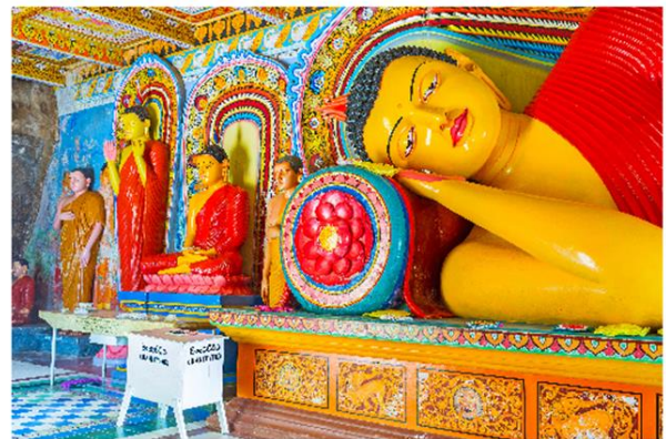
Statues du Bouddha au temple d'Isurumuniya, à Anuradhapura